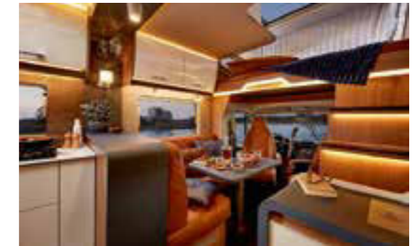
Bürstner Lyseo Gallery TD