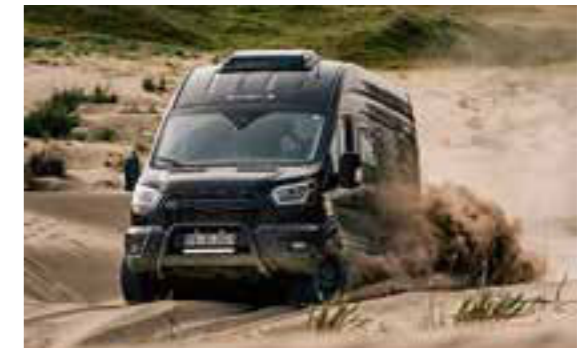
Sunlight Cliff 4x4