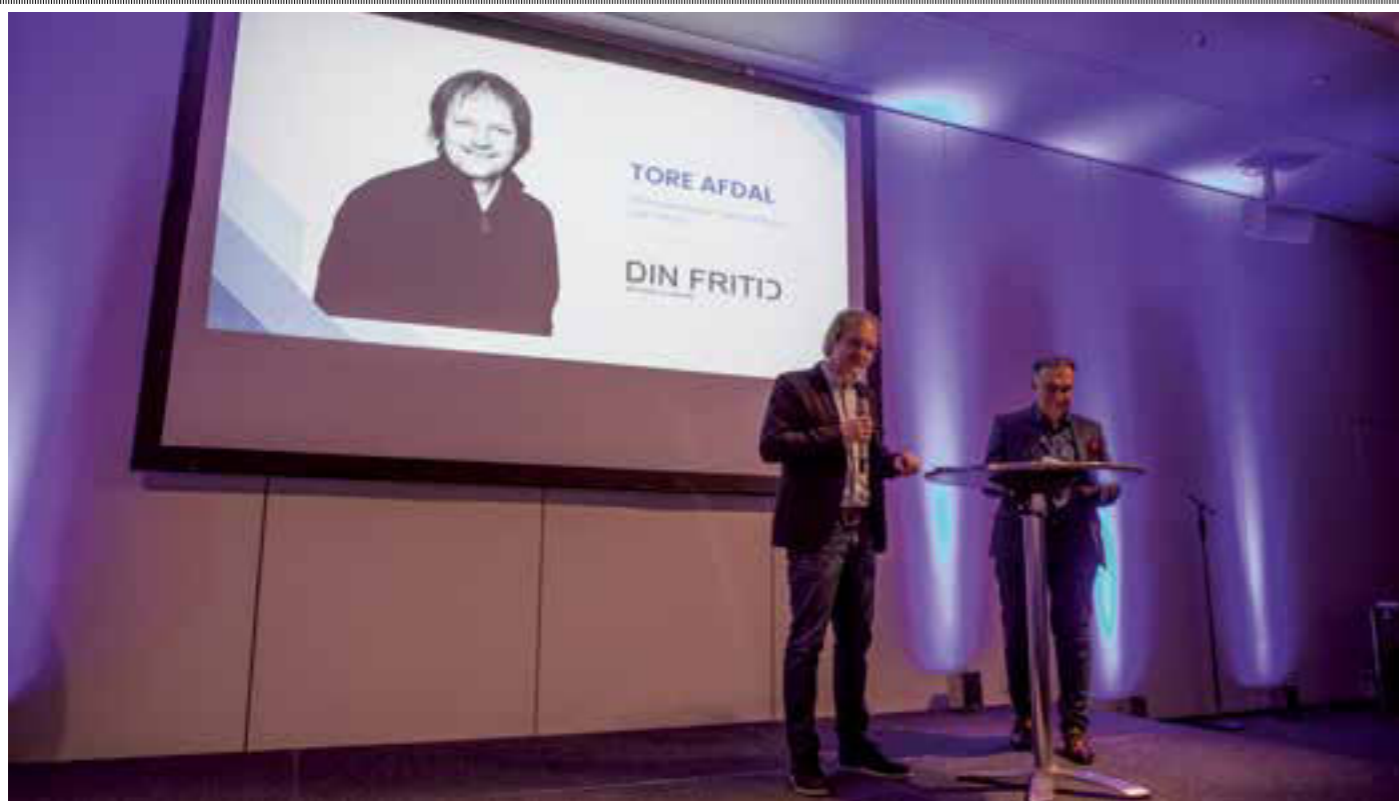
Din Fritid er norsk jurymedlem i den internasjonale kåringen European Innovation Award. Utdelingen skjer på en høytidelig middag i Stuttgart under CMT-messen.