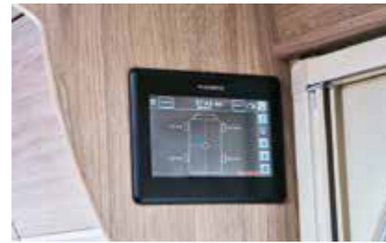
Kabe Smart Level Control