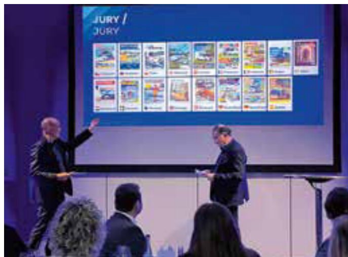
Jurymedlemmer fra de fleste europeiske land er den store styrken til European Innovation Award. I løpet av kvelden fikk 17 blide prisvinnere et synlig bevis.

hyggelig vertskap og en profesjonell gjennomføring gjorde dette til en vellykket kveld å minnes. Ikke bare for de fremmøtte, men også for de som kunne reise tilbake til sine medarbeidere med en velfortjent pris.