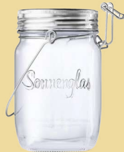
SONNENGLAS® Mini 8,5 x 8,5 x 11 cm 220 g