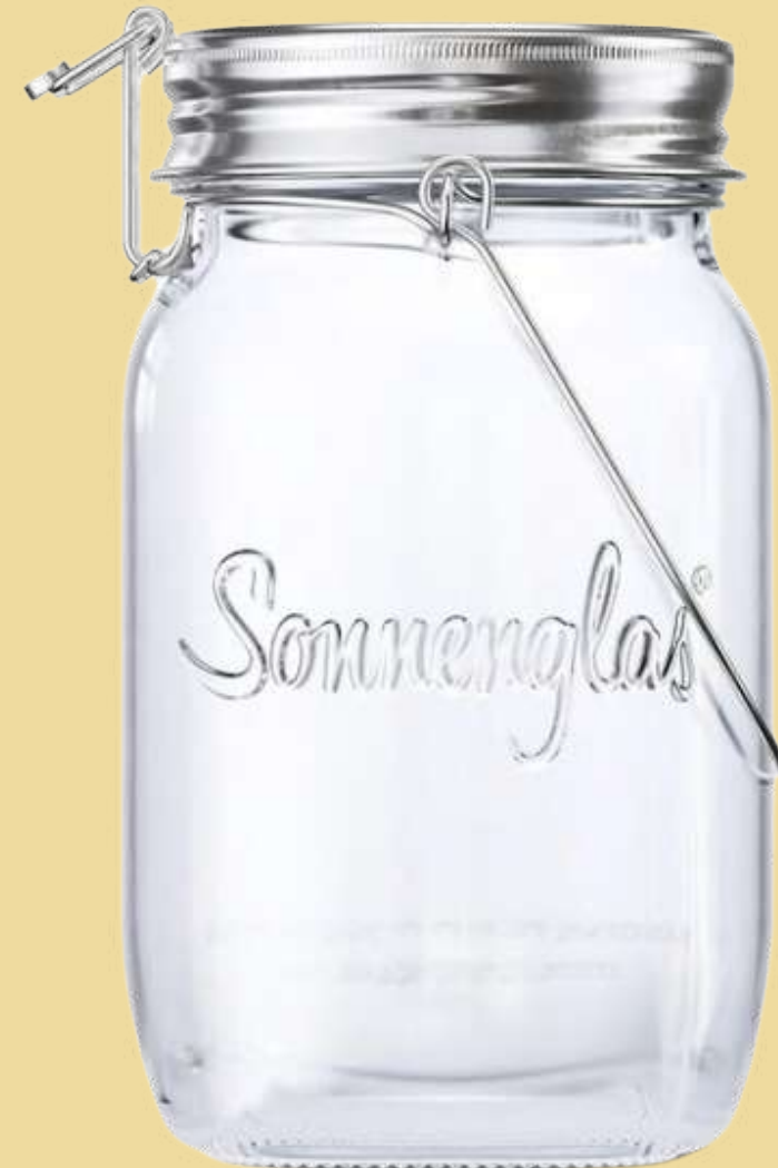
SONNENGLAS® Classic 11,5 x 11,5 x 17,5cm 640g