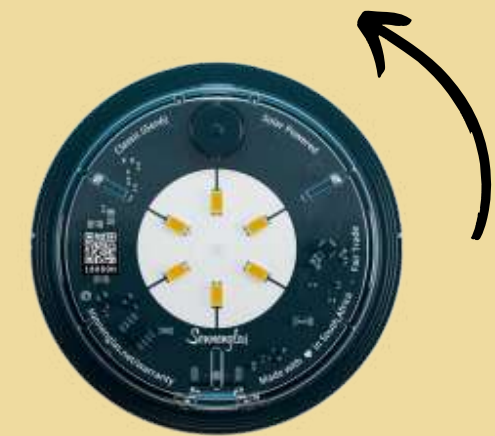
SONNENGLAS® SOMO Mini 6,0 x 1,8 cm 36g