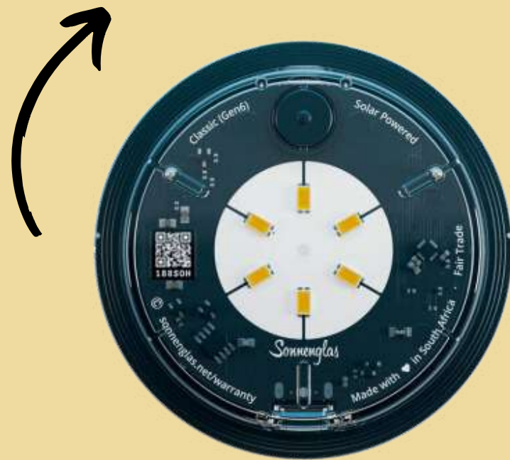
SONNENGLAS® SOMO Classic 8,5 x 1,8 cm 76g